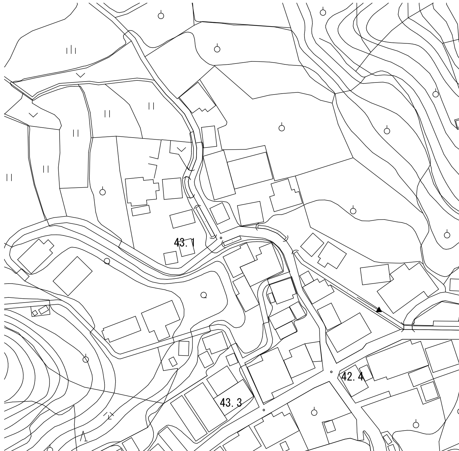
平 面 図 1 : 1000